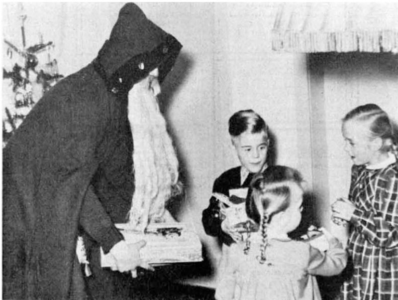
Der Weihnachtsmann bei unsern Kindern

Ulm. Weihnachtliche Schattenbilder. Gedichte und Lieder erfreuten Alt und Jung bei der Advents- und Weihnachtsfeier. Der Vorsitzende, Landsmann Korinth , gedachte in einer Ansprache der Heimat. An der mit wahren Bergen echt ostpreußischen Streuselkuchens besetzten Kaffeetafel schenkte der Weihnachtsmann den Kindern große bunte Tüten.