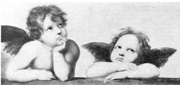
Die beiden Engelknaben