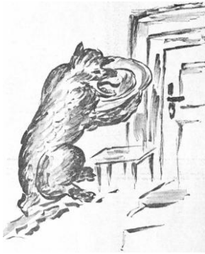
Zeichnung: Hedy Groß

Nun aber Schluss, man kann sich doch nicht mehr als einen Bären aufbinden lassen zu Weihnachten.